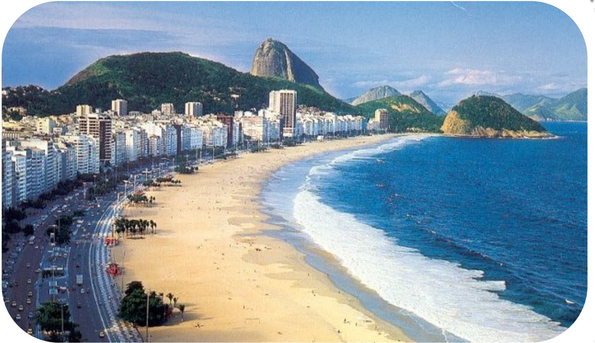
La plage de Copacabana