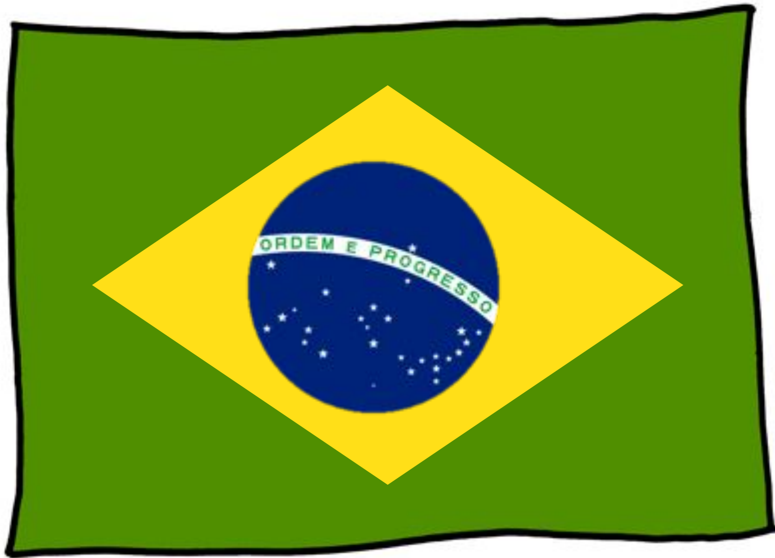
Le drapeau du Brésil