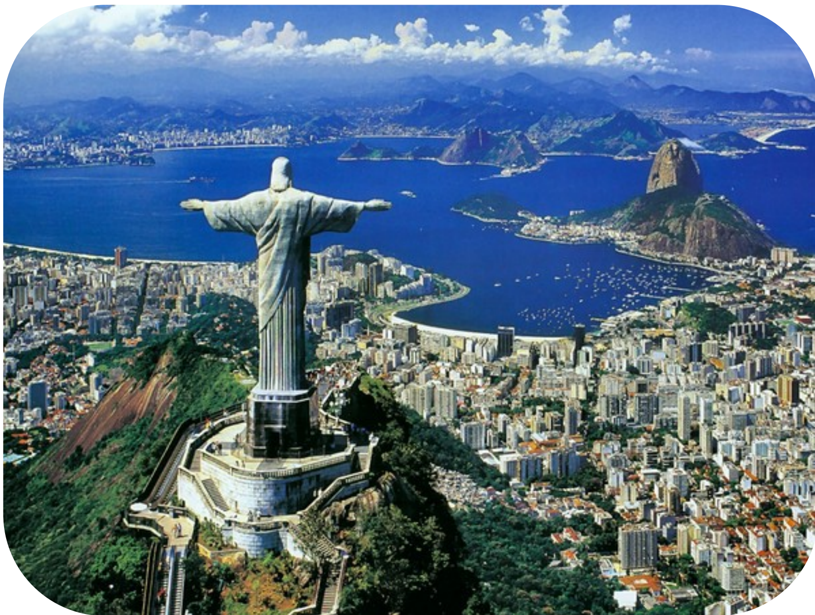
Rio de Janeiro.