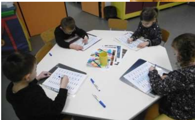
Tracer des ponts à l'endroit et à l'envers