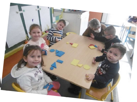
Travail sur les formes : reproduire un assemblage