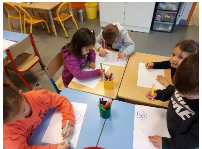
Tracer des spirales