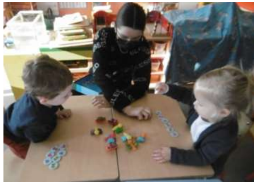
Jeu little observation