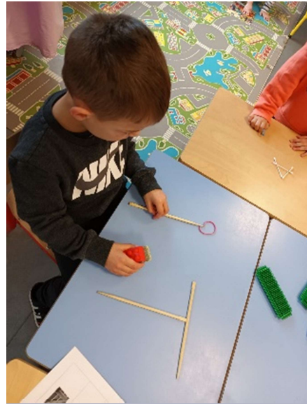
Travail sur les lettres de l'alphabet