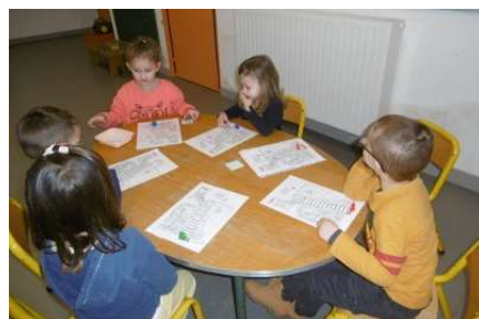
Jeu des pompiers pour décomposer en syllabes