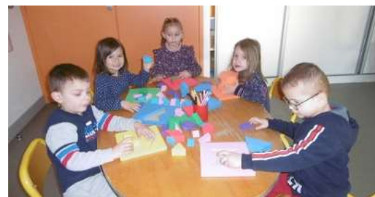
Atelier des formes en mousses : encastrement, superposition, pavages...