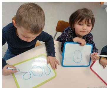
Travail sur les ronds