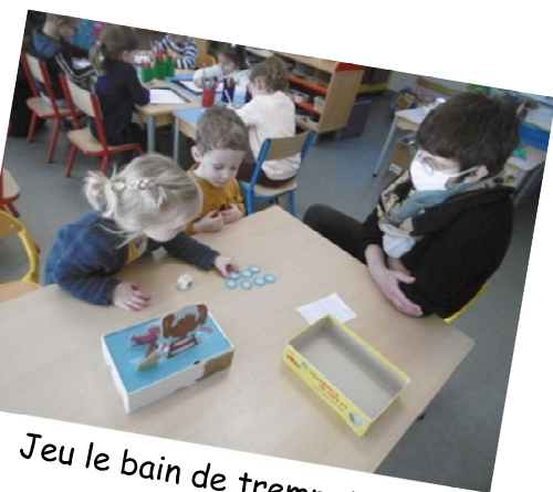
Jeu le bain de trempette