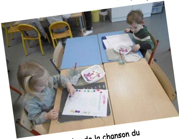
Décoration de la chanson du carnaval avec des confettis

Quelques photos de nos ateliers de TPS :