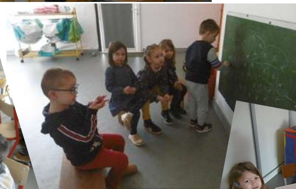
Travail sur les chiffres 0 à 4