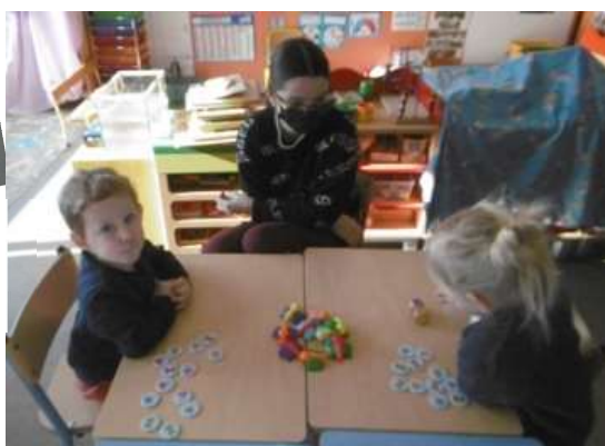
La table de manipulations