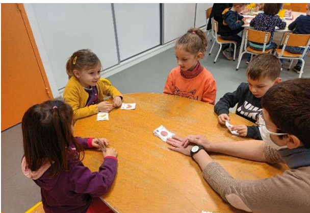
Vocabulaire sur les fruits et légumes du printemps