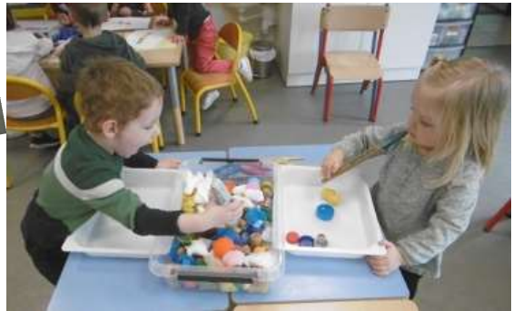
Jeu de la pêche