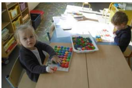
Des pions sur une grilles : des grands et des petits