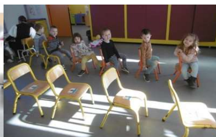
Jeu du train : travail sur l'ordre : le premier, le second, le dernier...