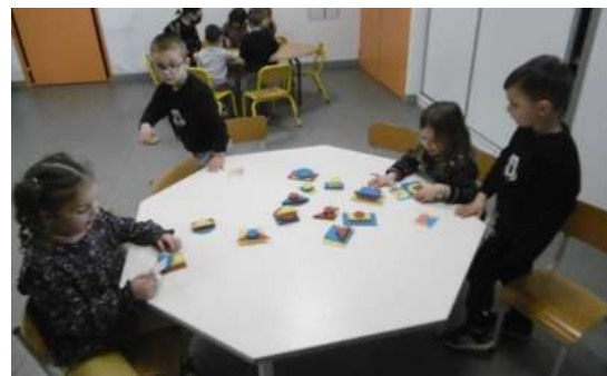
Empilements de formes