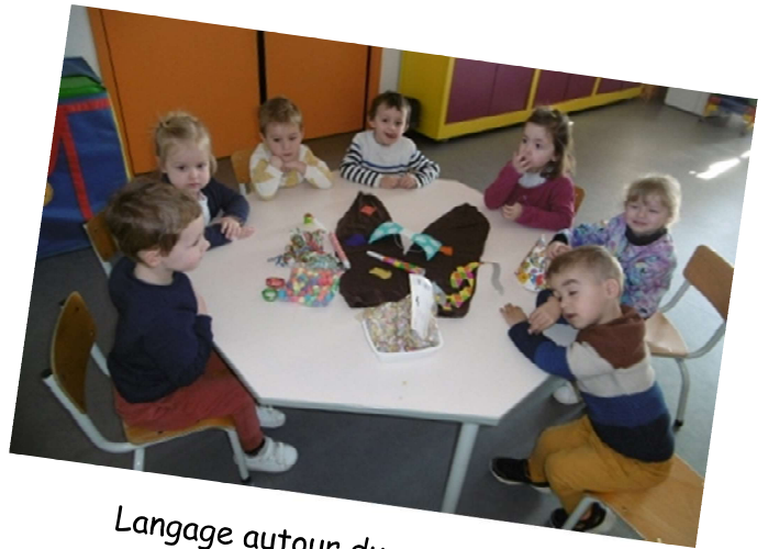
Langage autour du carnaval