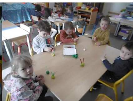
Jeu des 3 gâteaux avec 3 bougies chacun