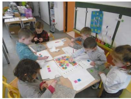
Travail sur les lettres du prénom : apprendre à retrouver les lettres et à les remettre dans l'ordre