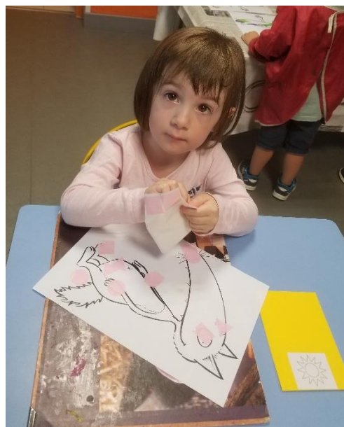
Collage de gommettes