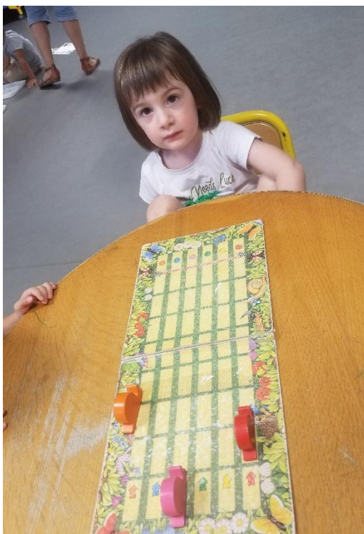
Le jeu des escargots