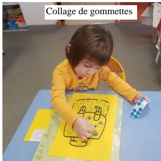
Collage de gommettes