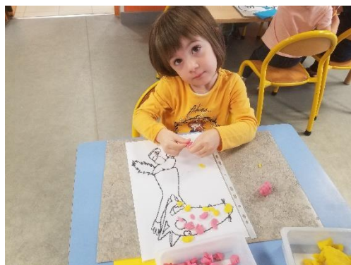
Pâte à modeler