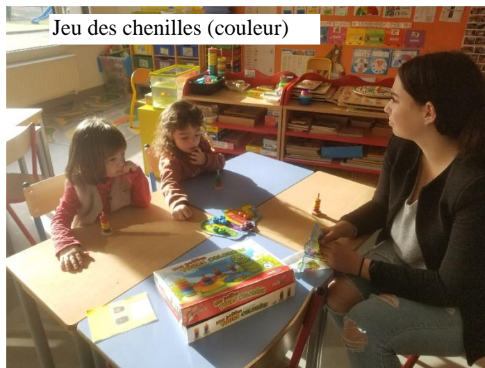
Jeu des chenilles (couleur)