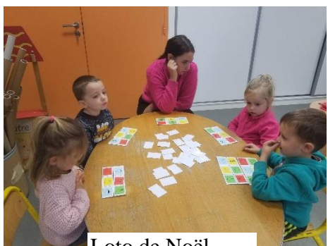
Loto de Noël