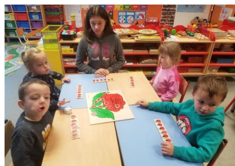
Jeu des constellations de coccinelles