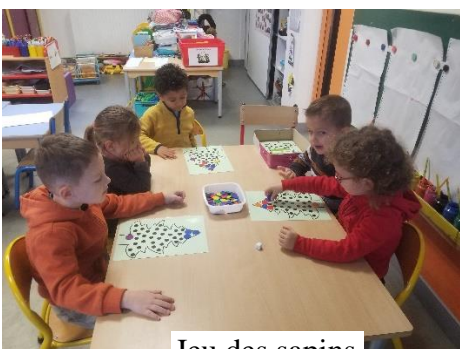
Jeu des sapins