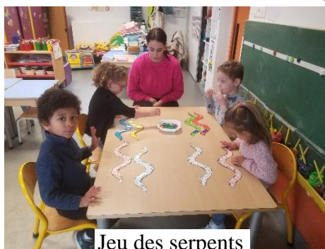
Jeu des serpents