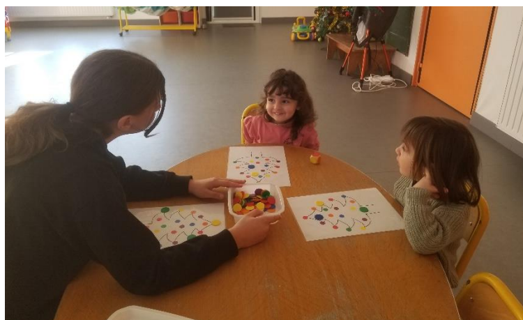
Jeu des guirlandes