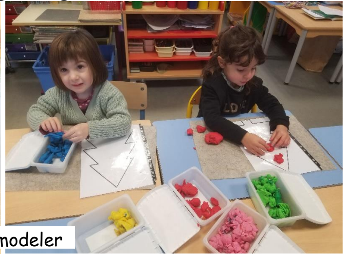
Pâte à modeler