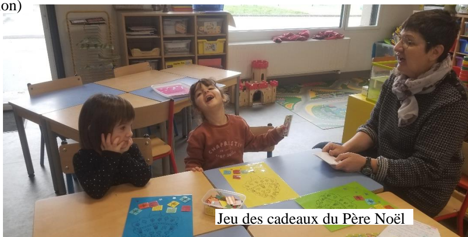
Jeu des cadeaux du Père Noël