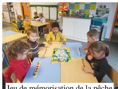
Jeu de mémorisation de la pêche