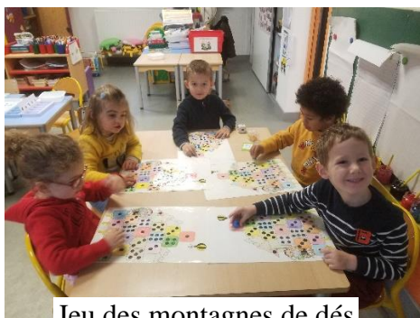
Jeu des montagnes de dés