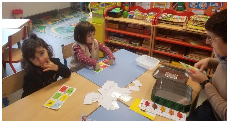
Loto de l'automne