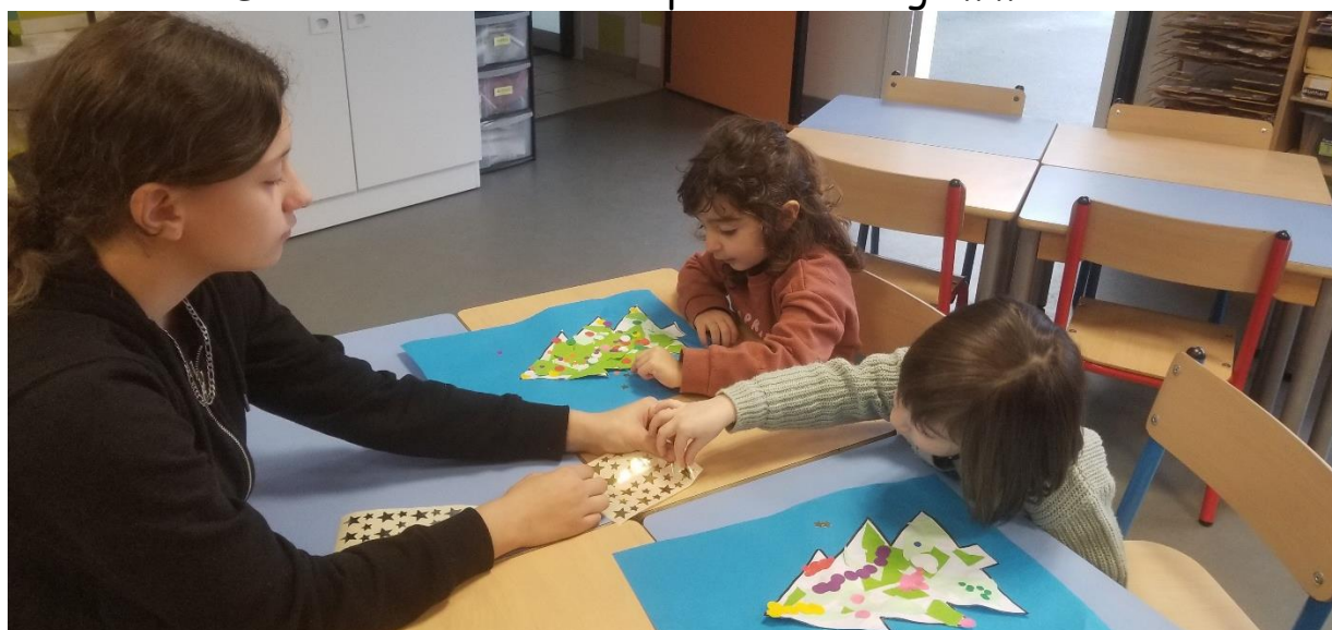
Motricité fine :