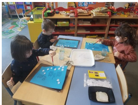
Décorer les chants : coloriage et collage de flocons