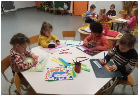
Écriture de Bonne Année 2024