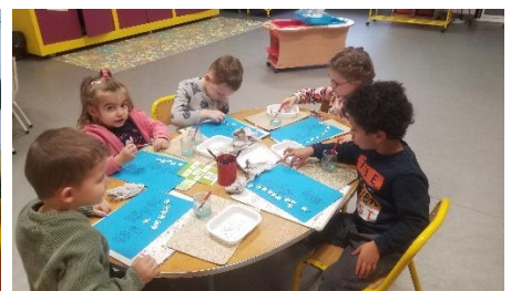
Décoration de la chanson