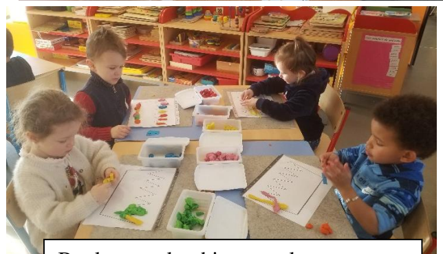
Boules et colombins pour la couronne