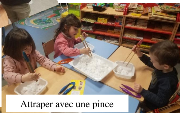
Attraper avec une pince