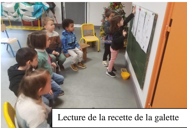
Lecture de la recette de la galette