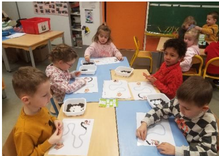
Motricité fine : chemin de graines