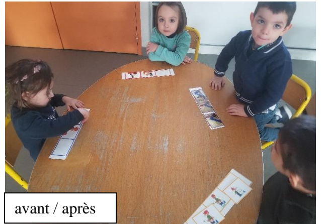
avant / après