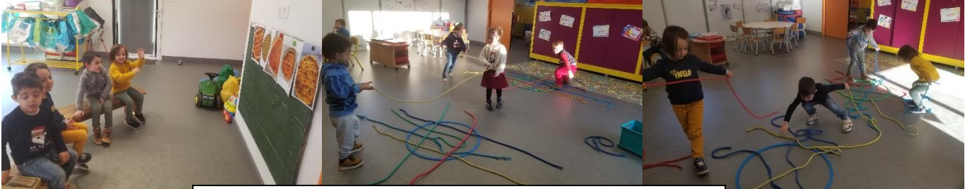
Apprendre à tracer un quadrillage avec les « Nathalie »