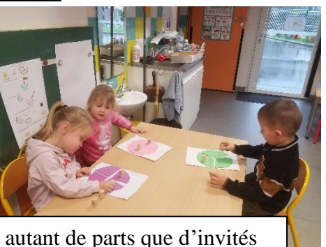
Jeu des galettes : aller acheter une galette qui a autant de parts que d'invités