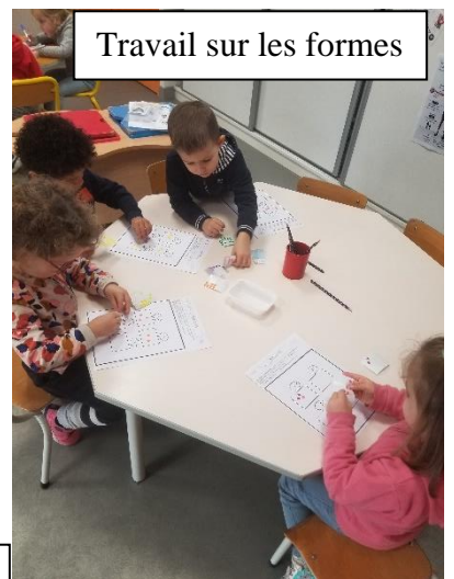
Travail sur les formes