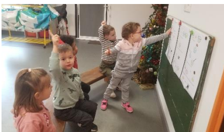
Lecture de la recette de la galette