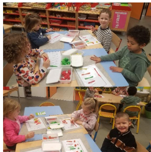
Décoration d'une couronne avec des boules et des colombins de pâte à modeler