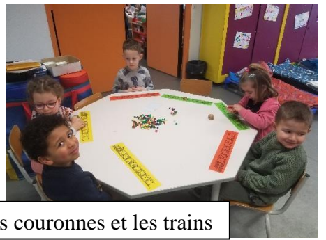
Jeux de numération avec les chiffres et les constellations: les couronnes et les trains