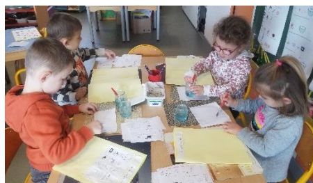
Remise en ordre de la recette