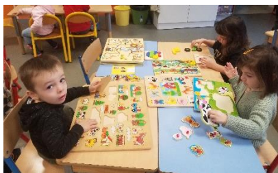
Encastrement et puzzles des moitiés