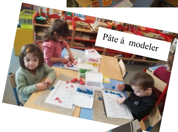
Pâte à modeler