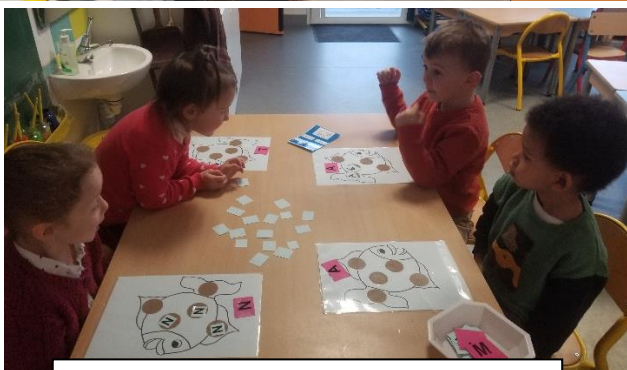
Apprendre à reconnaître son initiale