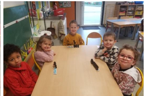
Jeu des pingouins