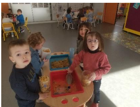
Table de manipulation