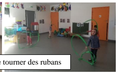
Faire tourner des rubans