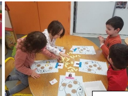
Travail sur le prénom