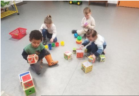
Objets gigognes à classer en ordre de taille

Voici quelques photos de nos autres ateliers en PS :