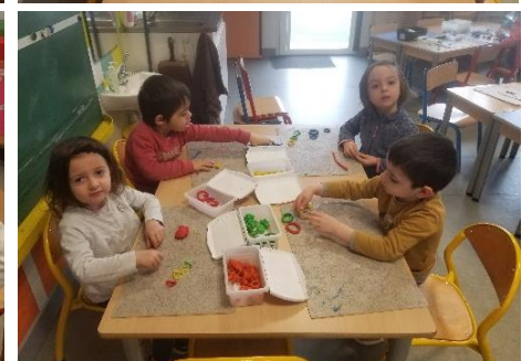
Faire des ronds avec du matériel