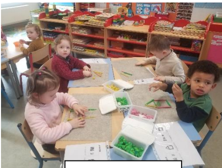
Pâte à modeler