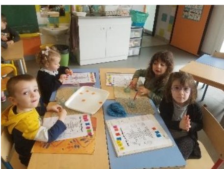
Coller des oeufs