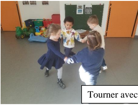
Tourner avec son corps