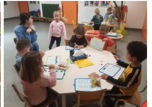
Travail sur les ponts à l'envers