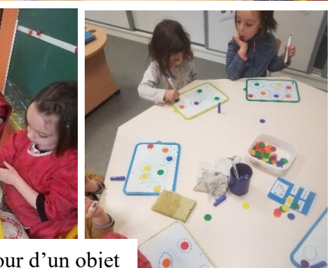
Tracer des ronds autour d'un objet