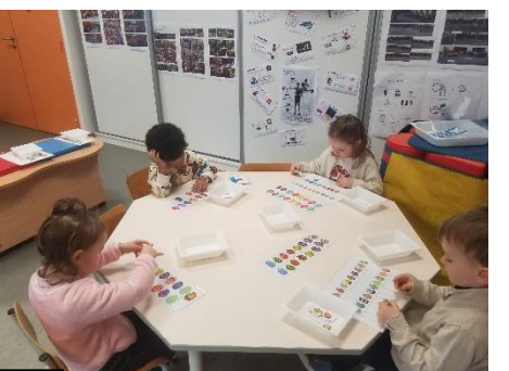
Jeu d'observation des œufs de Pâques