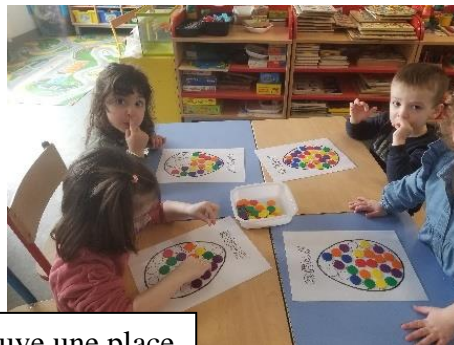
Chacun trouve une place