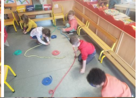
Travail sur les spirales