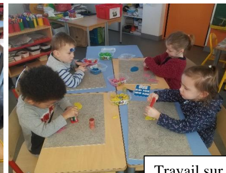
Travail sur les formes