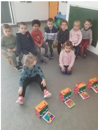
Travail sur les émotions