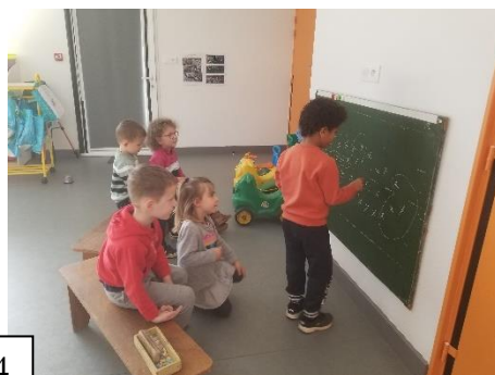
Travail sur le chiffre et la quantité 4