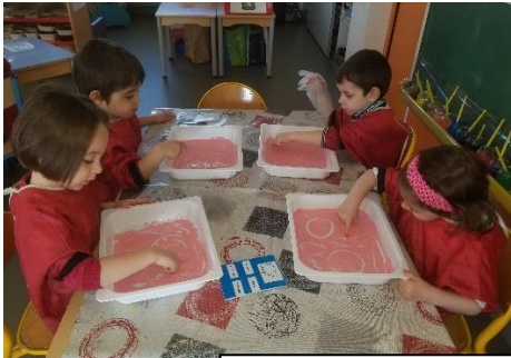
Graphisme : tracer des ronds

Voici quelques photos de nos autres ateliers en PS :