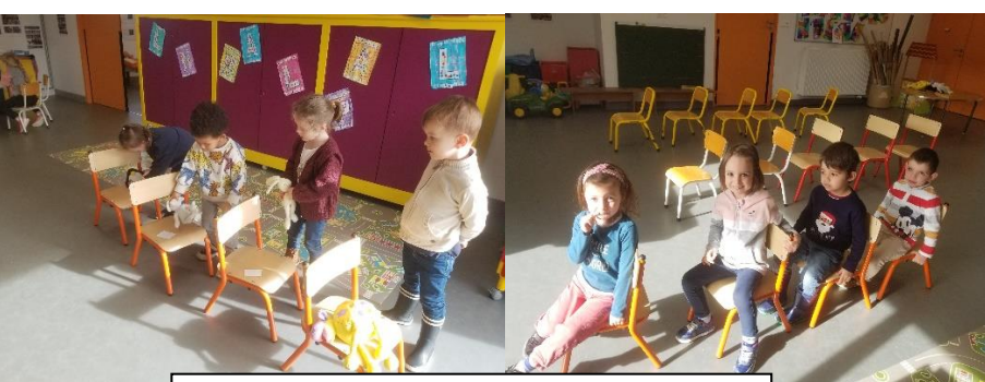
Le train : retrouver l'ordre 1er, 2ème...