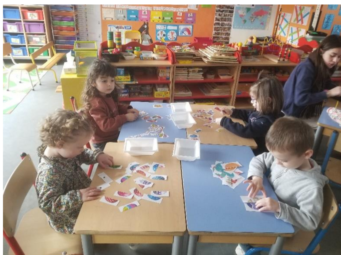
Observation : retrouver l'autre moitié de l'oeuf