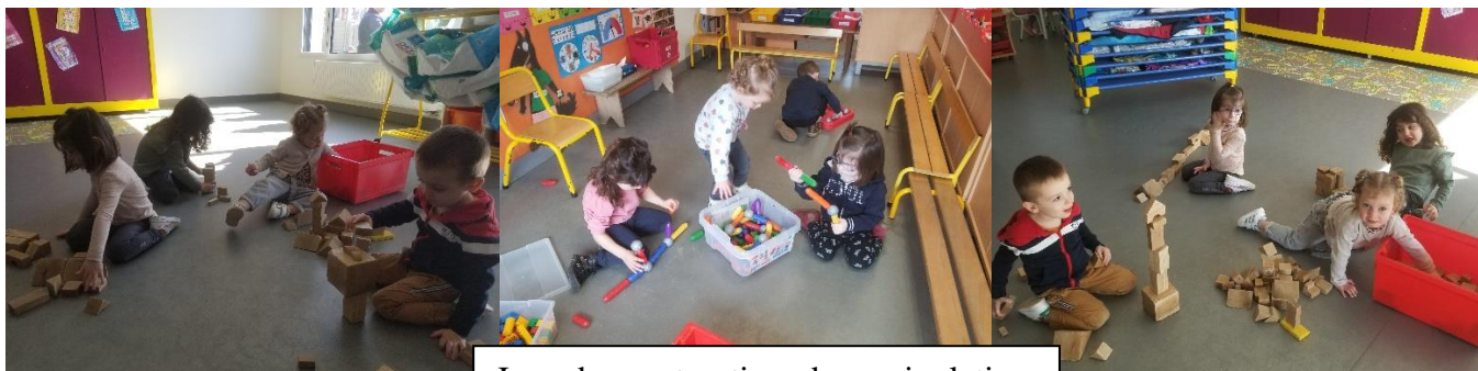
Jeux de construction, de manipulation