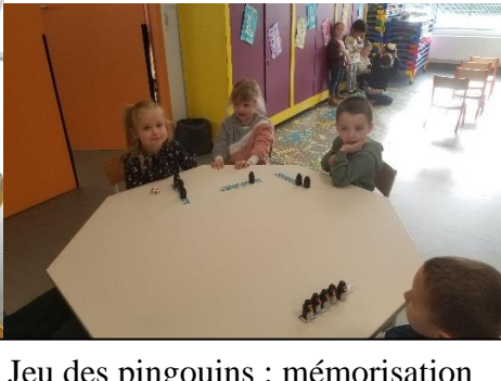
Jeu des pingouins : mémorisation