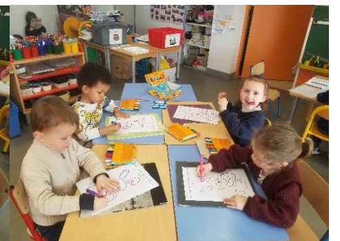
Repasser sur des pointillés