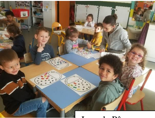
Jeux de Pâques sur les quantités