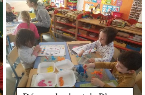
Décorer le chant de Pâques