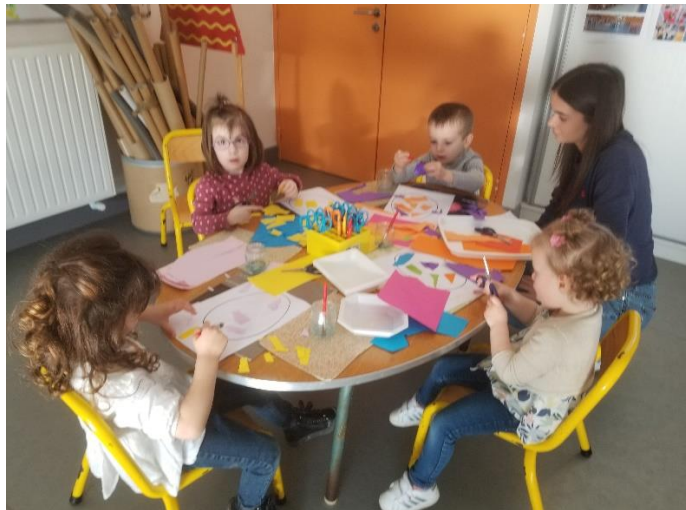
Découpage, collage pour décorer un œuf de Pâques