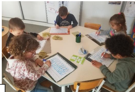
Graphisme : les spirales et les tuiles