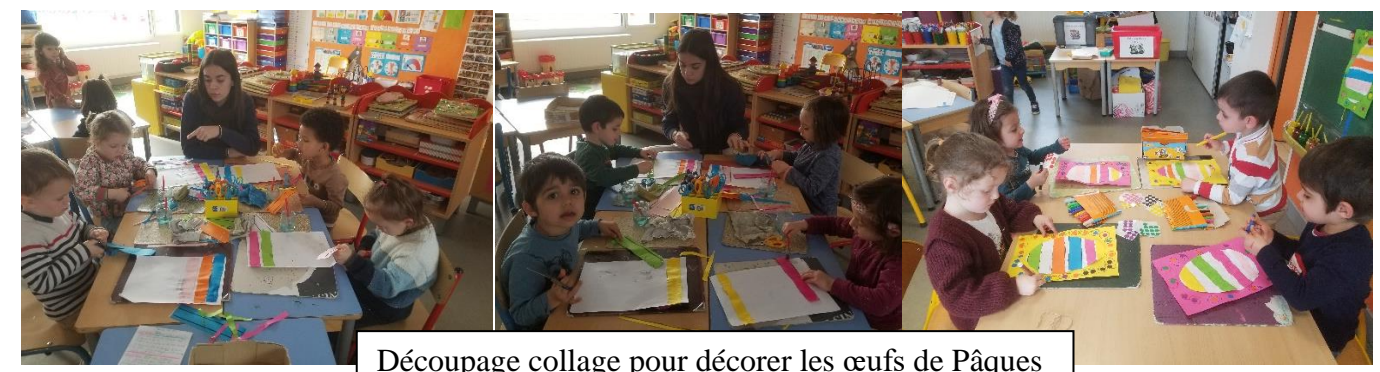
Découpage collage pour décorer les œufs de Pâques