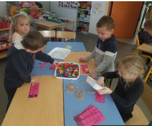
Reconstituer des mots de Pâques