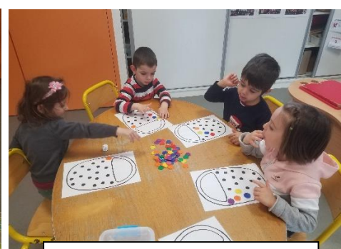
Numération : jeu du panier