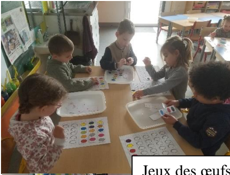
Jeux des œufs : décomposer 5