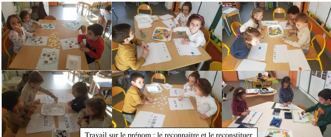
Travail sur le prénom : le reconnaître et le reconstituer