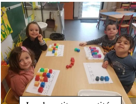
Jeu de petites quantités