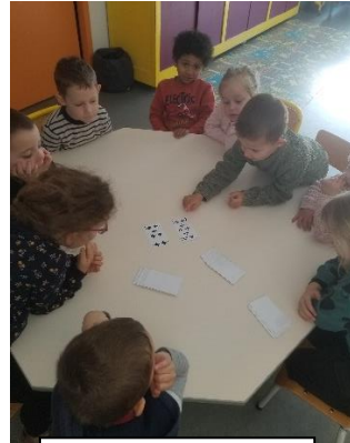
Jeux de bataille