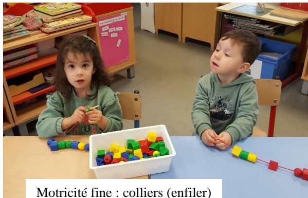
Motricité fine : colliers (enfiler)