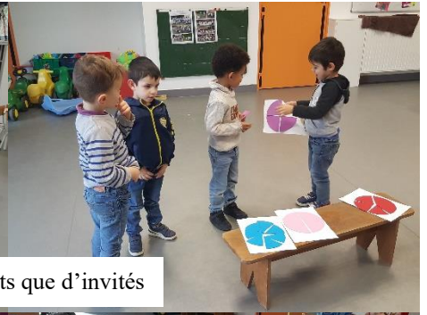
Autant de parts que d'invités