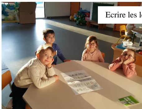
Ecrire les lettres obliques