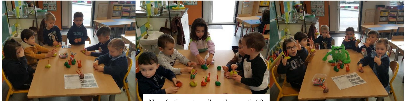
Numération : travail sur la quantité 3