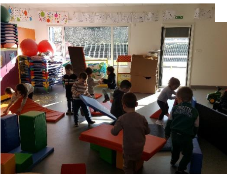
Sport : construire ensemble avec du matériel