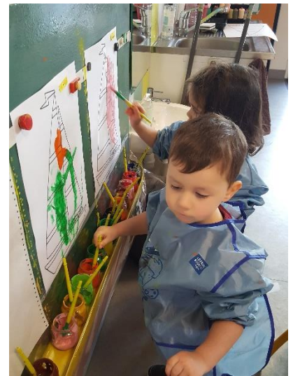
Peinture libre au chevalet