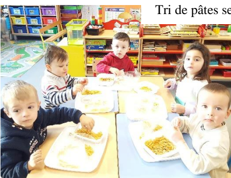
Tri de pâtes selon la forme