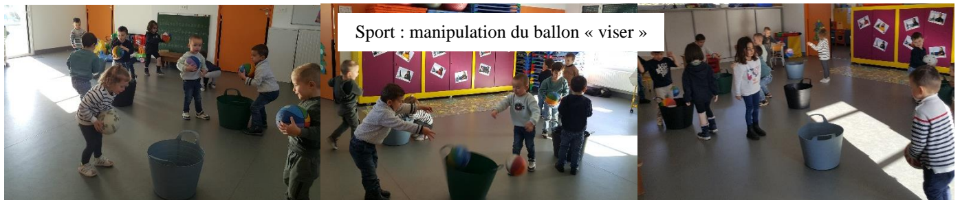
Sport : manipulation du ballon « viser »