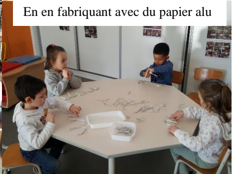
En en fabriquant avec du papier alu