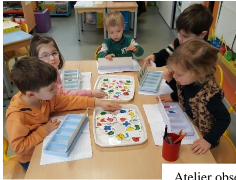
Atelier observation, tri