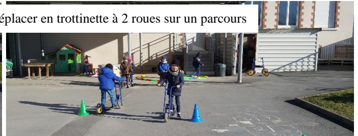
Sport : se déplacer en trottinette à 2 roues sur un parcours