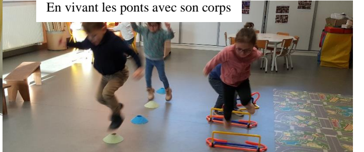
En vivant les ponts avec son corps