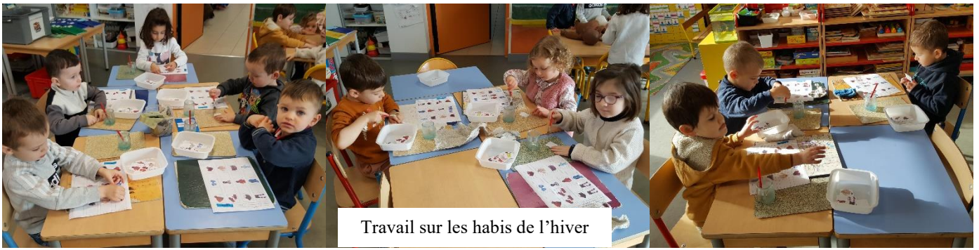
Travail sur les habits de l'hiver