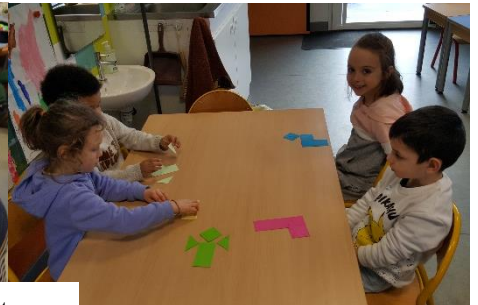
Travail sur les formes : repérer les cotés, les sommets...