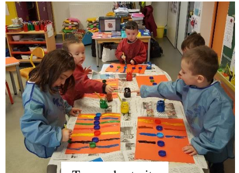
Tracer des traits