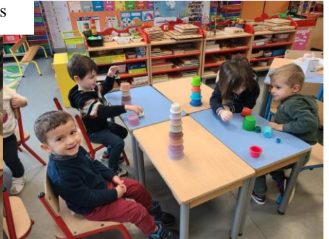
Objets gigognes à classer du plus grand au plus petit