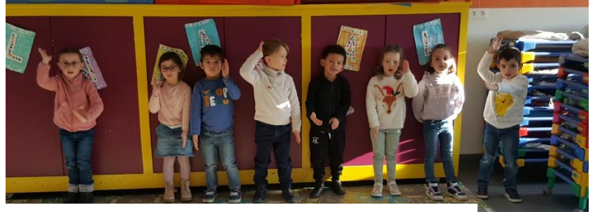
Phonologie : travail sur l'articulation et sur le langage ROBOT (couper les mots en syllabes orales)