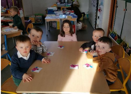
Travail sur les initiales : apprendre à reconnaître la sienne