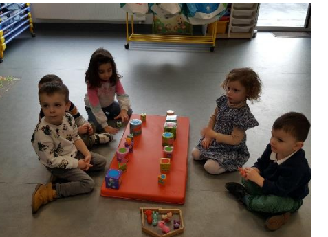
Travail sur les chemins