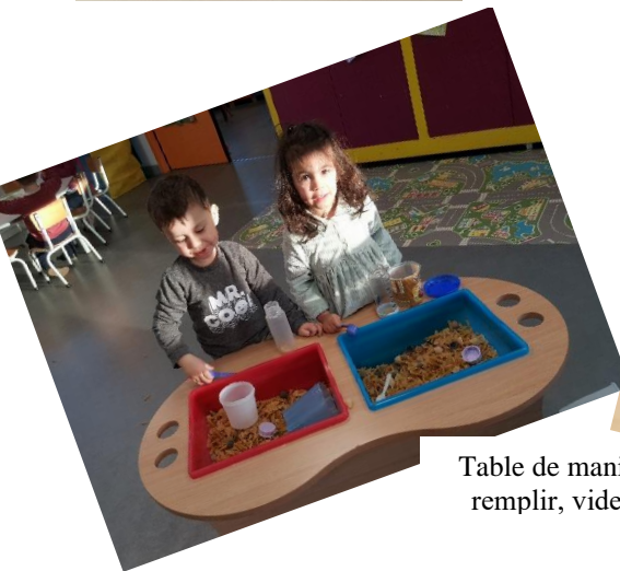
Table de manipulation : remplir, vider, trier...