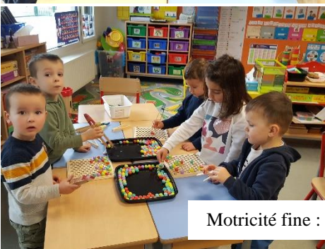
Motricité fine : pinces et billes