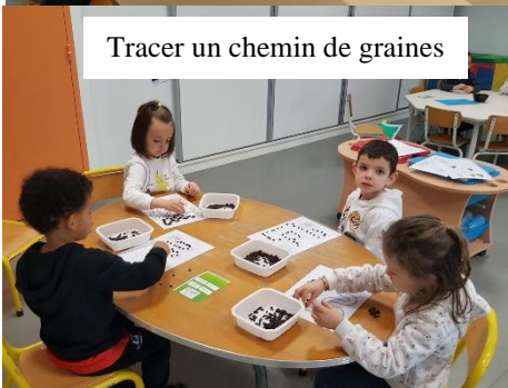
Tracer un chemin de graines