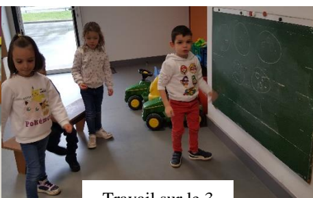
Travail sur le 3