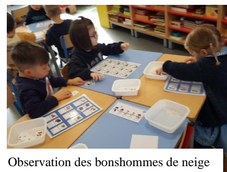
Observation des bonshommes de neige