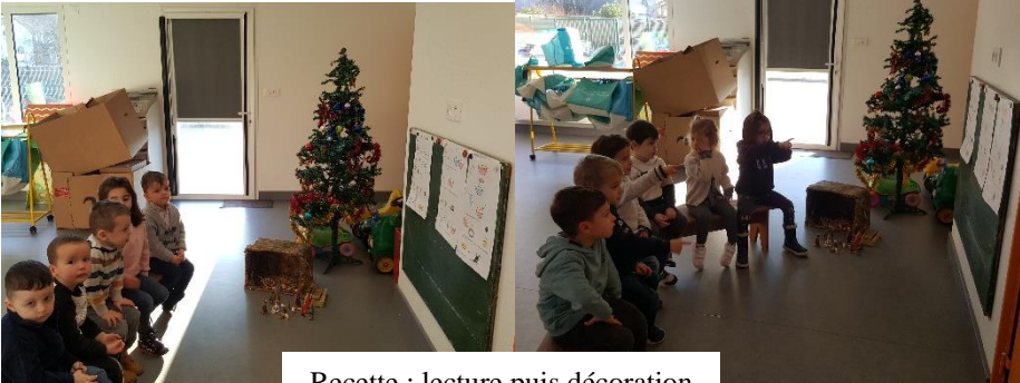
Recette : lecture puis décoration