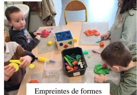
Empreintes de formes