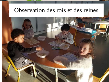
Observation des rois et des reines