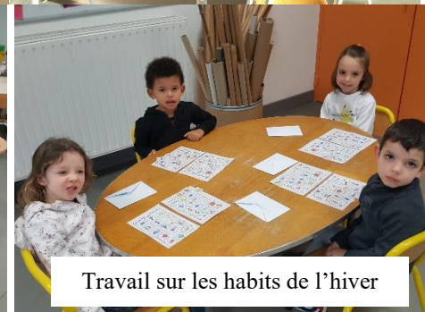
Travail sur les habits de l'hiver