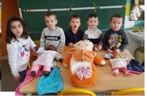
Poupées et habits petits/moyens et grands