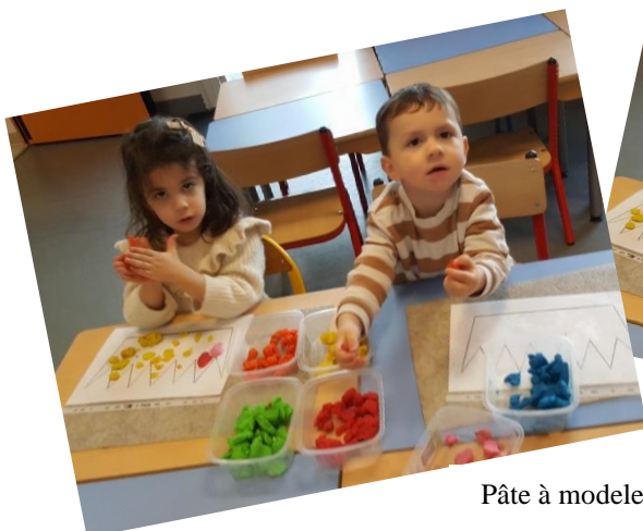
Pâte à modeler : décorer une galette