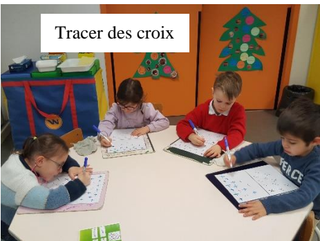
Tracer des croix