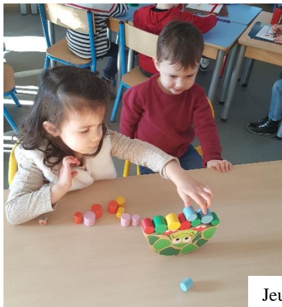
Jeu de la tortue