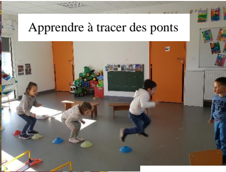
Apprendre à tracer des ponts