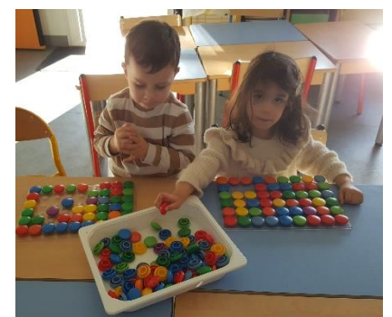
Pions sur la grille