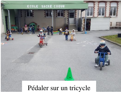
Pédaler sur un tricycle