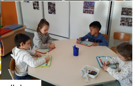
En les traçant en grand au tableau, puis en s'entraînant sur velledas