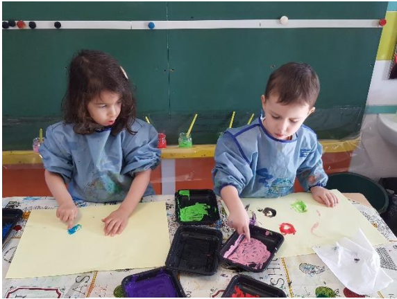
Peinture au doigt