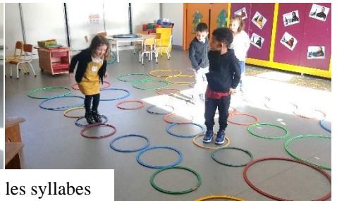
Sauter selon les syllabes