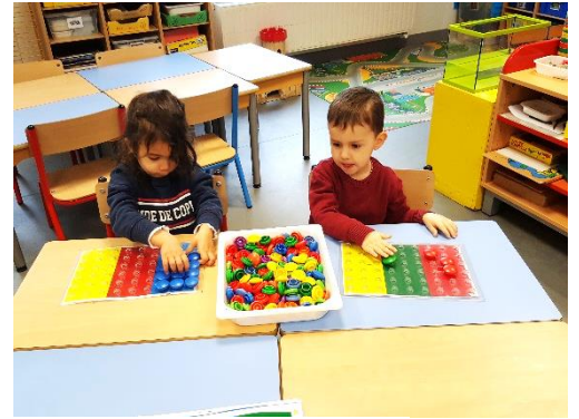
Formes et couleurs : encastements et pavages