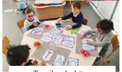
Travail sur les lettres