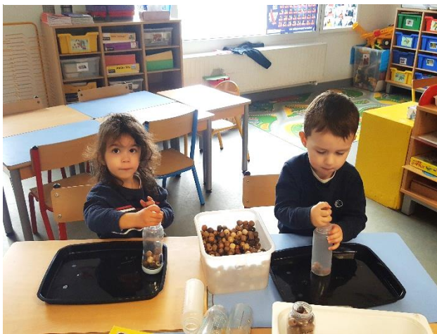
Motricité fine : remplir, pincer et attraper avec une pince