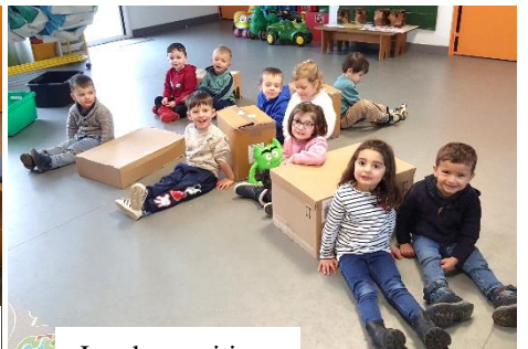
Jeu des positions