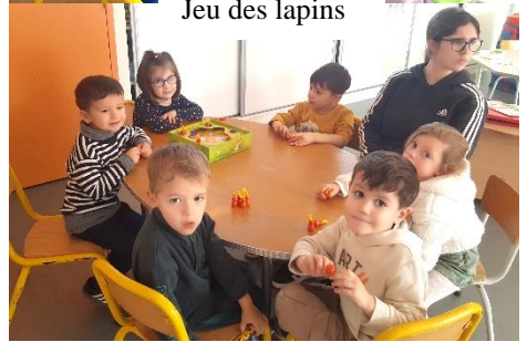
Algorithme à 2 couleurs