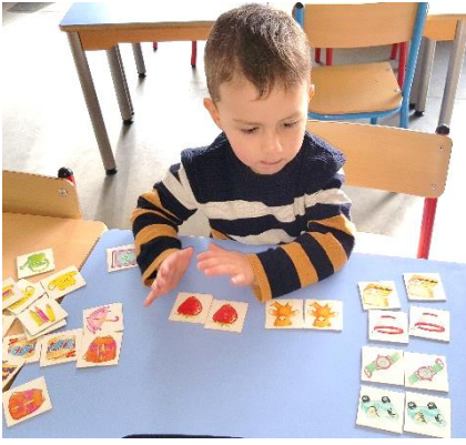
Observation : retrouver les paires