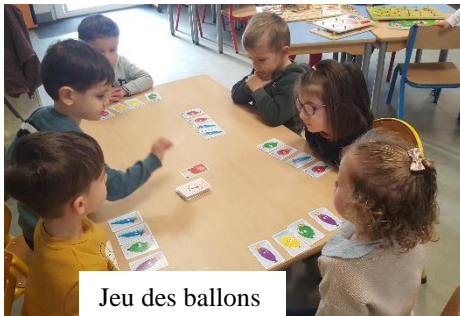
Jeu des ballons