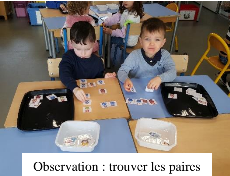
Observation : trouver les paires