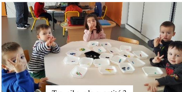
Travail sur la quantité 3