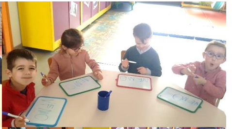
Lecture des mots Mimi et Néo