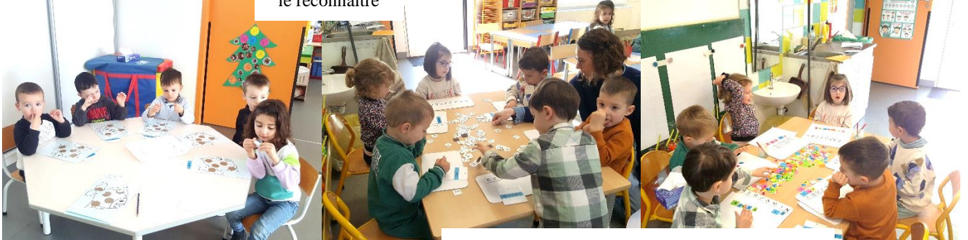
retrouver les lettres et les remettre dans l'ordre