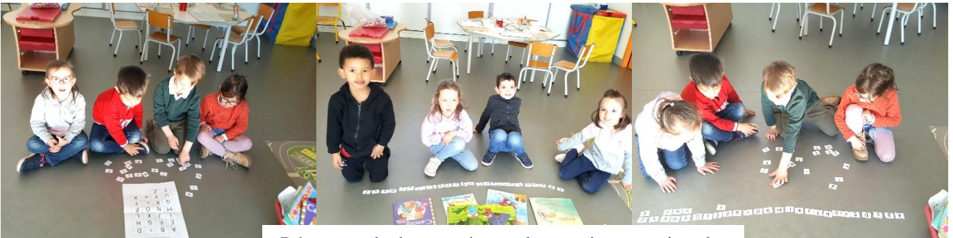
Découverte des lettres scriptes et les associer aux majuscules