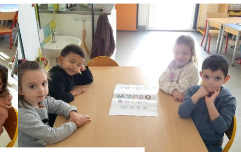
Travail sur les lettres combinées : traits et ponts