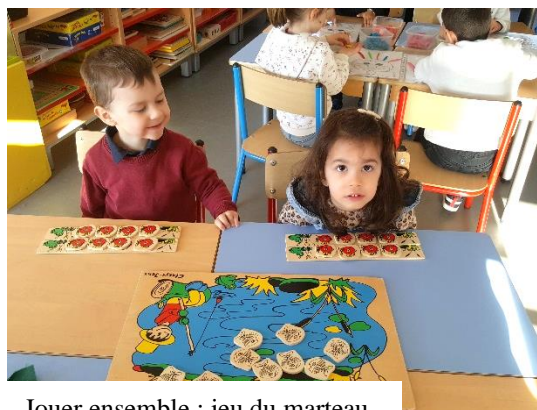
Jouer ensemble : jeu du marteau, jeu des poissons