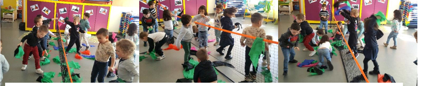
Jeu des balles brûlantes : lancer des balles brûlantes (foulards) dans l'autre camp.