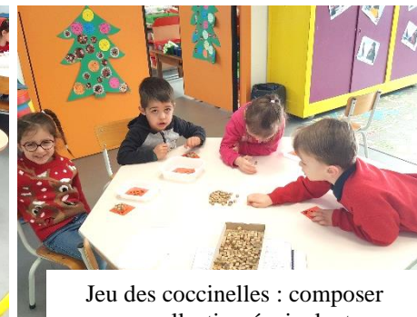
Jeu des coccinelles : composer une collection équivalente