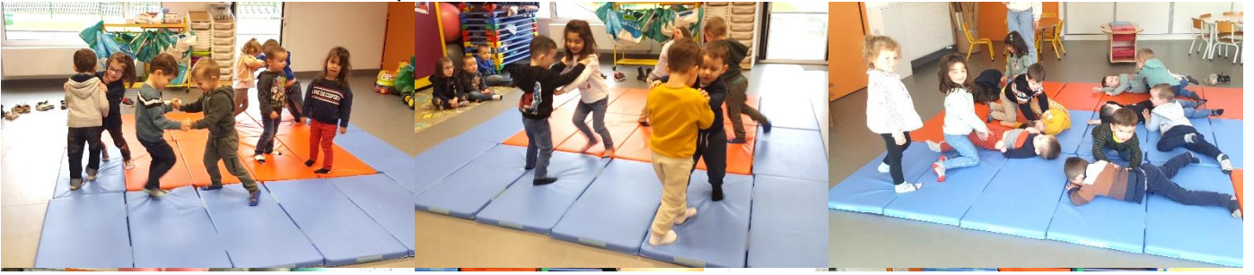
En sport on a appris à faire comme du Judo (jeux d'opposition) : il fallait faire sortir le copain du tapis ou bien le retourner