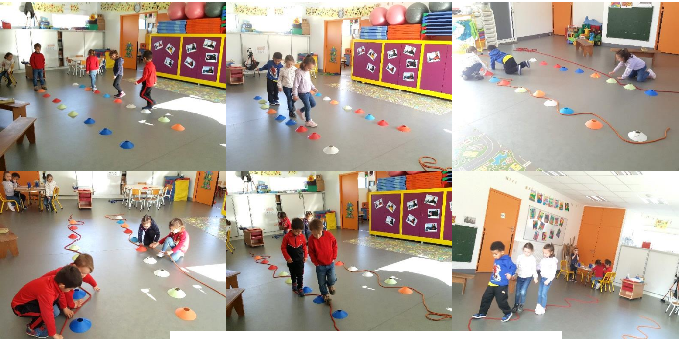
Travail sur les vagues : avec le corps, la main et tracer avec un crayon