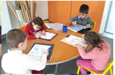
Graphisme : les spirales et les ponts