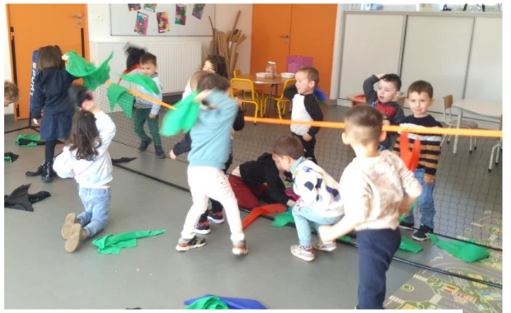
Jeu des balles brûlantes : lancer des balles brûlantes (foulards) dans l'autre camp.