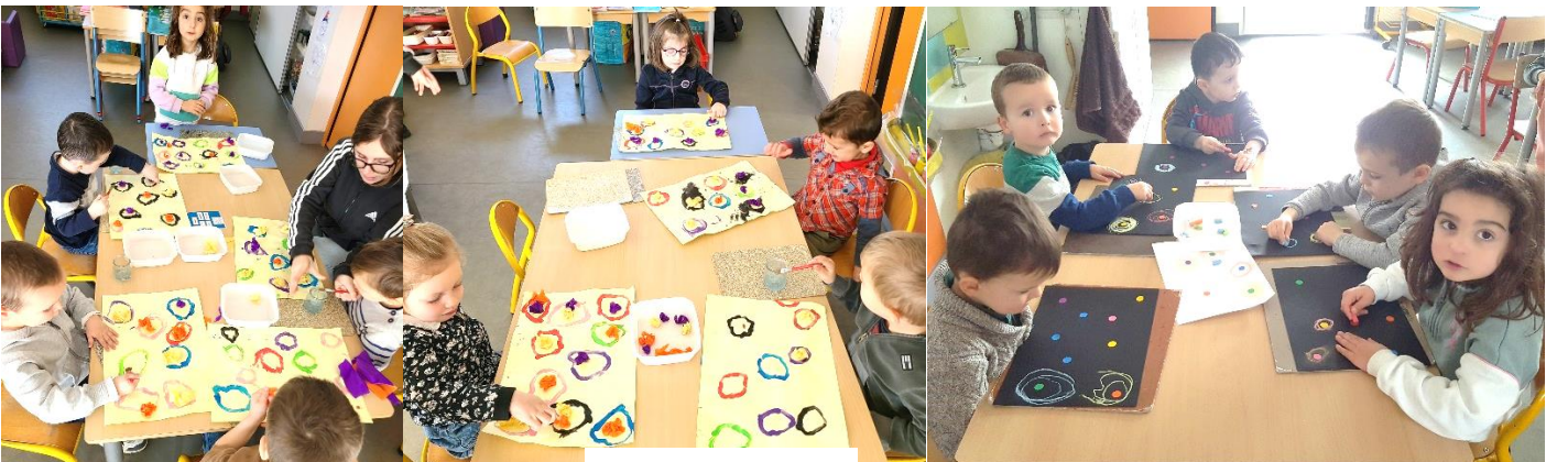
Tracer des ronds