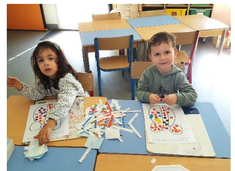
Décorer avec des gommettes