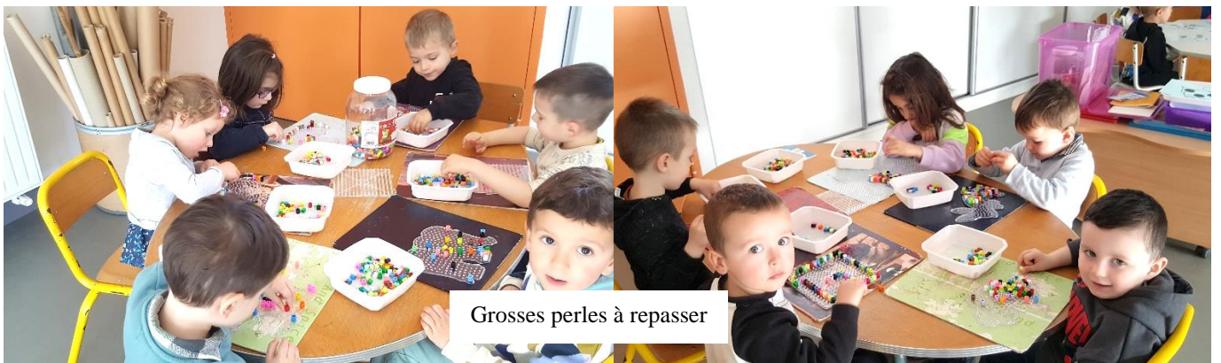
Grosses perles à repasser