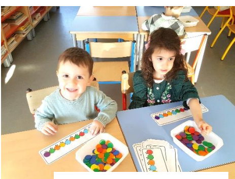
Trouver la même couleur