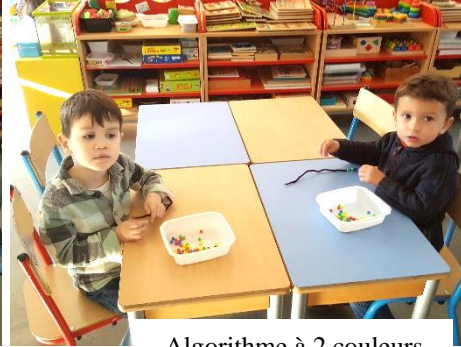
Algorithme à 2 couleurs