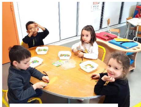
Algorithme à 3 ou 4 couleurs