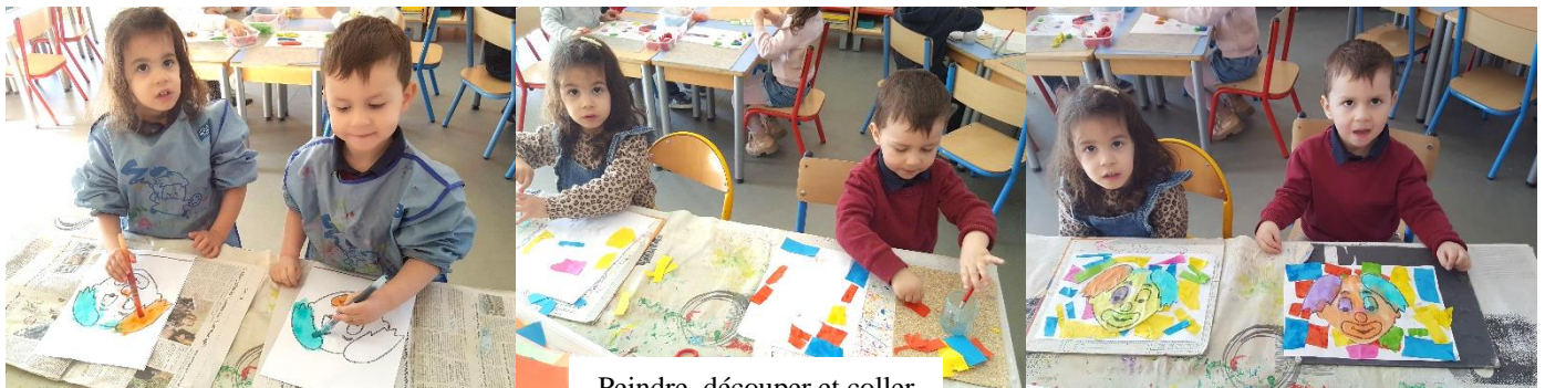
Peindre, découper et coller