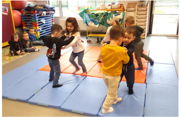
En sport on a appris à faire comme du Judo (jeux d'opposition) : il fallait faire sortir le copain du tapis ou bien le retourner