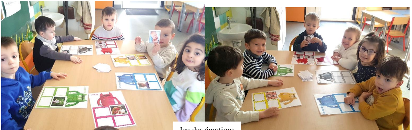
Jeu des émotions