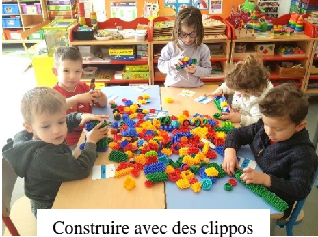
Construire avec des clippos