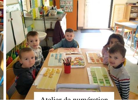
Atelier de numération