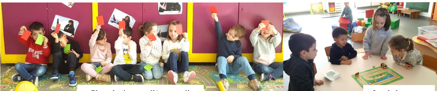
Phonologie : pareil/pas pareil