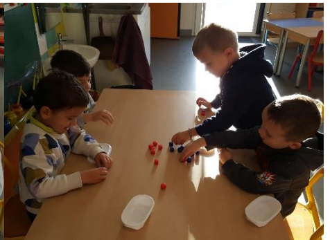
Comparer des quantités visuellement et en correspondance terme à terme