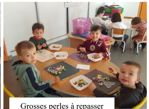
Grosses perles à repasser