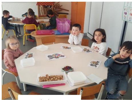
Jeu de la tortue