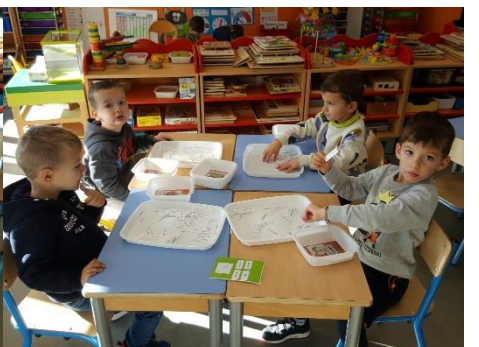
Retrouver les mots identiques aux modèles