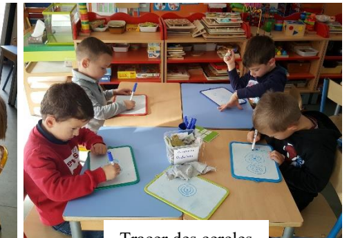
Tracer des cercles