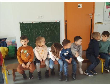
Jeu du téléphone arabe : bien écouter et bien bien répéter