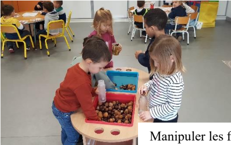
Manipuler les fruits d'automne