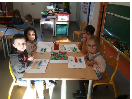
Atelier numération pour le cahier d'atelier