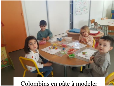
Colombins en pâte à modeler