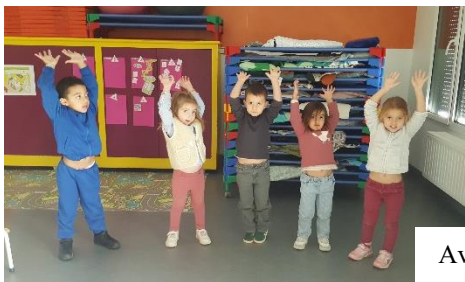
Avec notre corps

Nous avons aussi appris à tracer des lignes verticales :