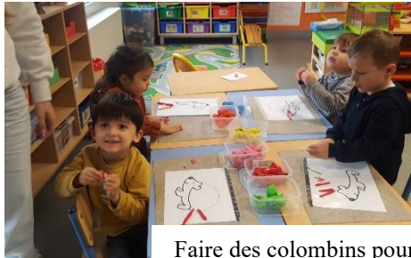
Faire des colombins pour représenter les piquants de hérissons