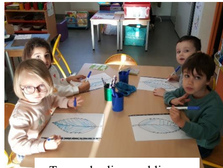
Tracer des lignes obliques