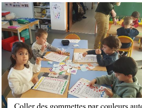
Coller des gommettes par couleurs autour du chant des jours de la semaine