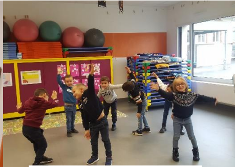
Tracer des lignes obliques