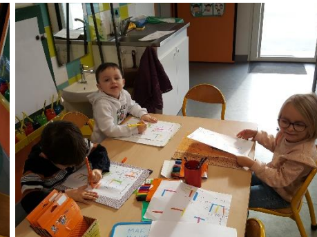
Ecrire les lettres droites