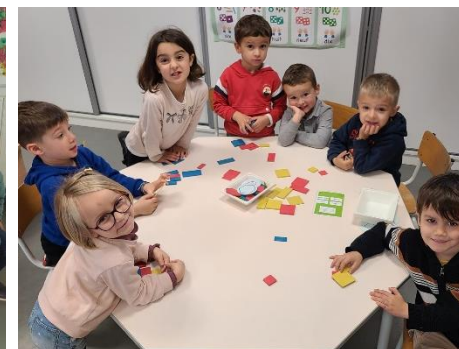
Jeu avec les formes