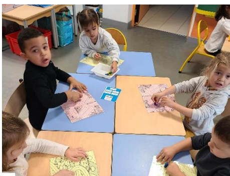
Créer et suivre un chemin