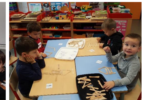
Reproduire un dessin avec des batonnets