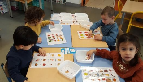
Observation de l'automne : retrouver les mêmes images