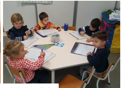
Ensuite on en a tracé en grand au tableau et on s'est entraînés sur velleda