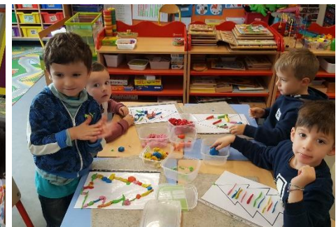
Faire des boules et des guirlandes pour décorer le sapin