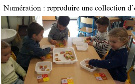
Numération : reproduire une collection d'objets