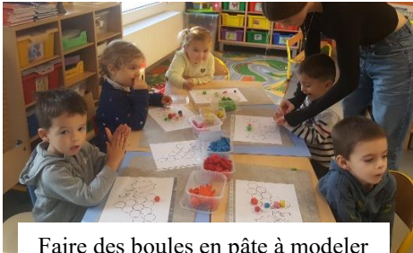
Faire des boules en pâte à modeler