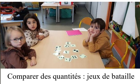
Comparer des quantités : jeux de bataille