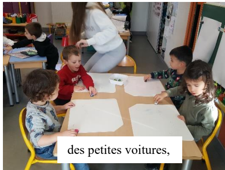
des petites voitures,