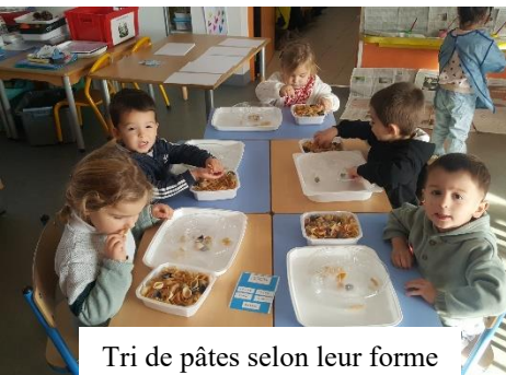
Tri de pâtes selon leur forme