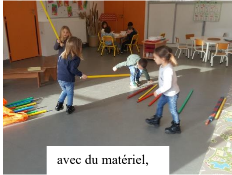
avec du matériel,