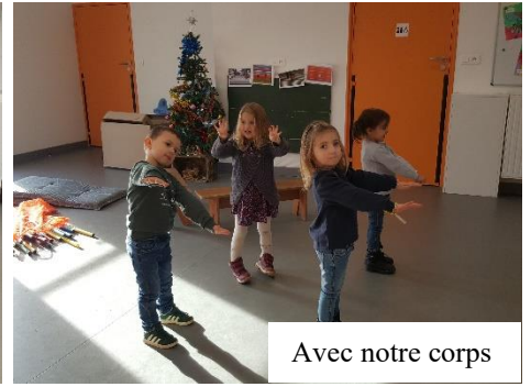
Avec notre corps