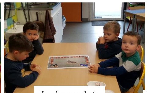
Jeu des manchots