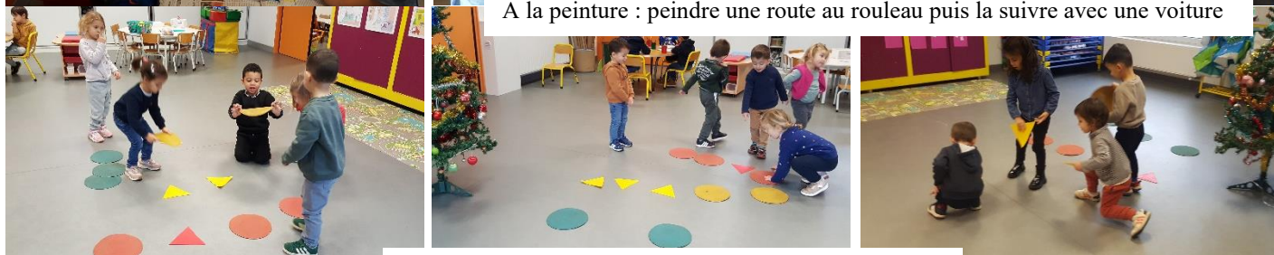
Tracer un chemin de couleur jusqu'au sapin et le suivre