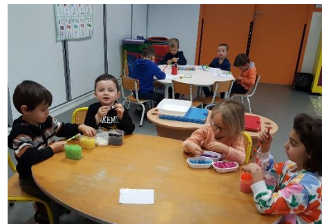
Poursuivre un algorithme à 3 ou 4 couleurs