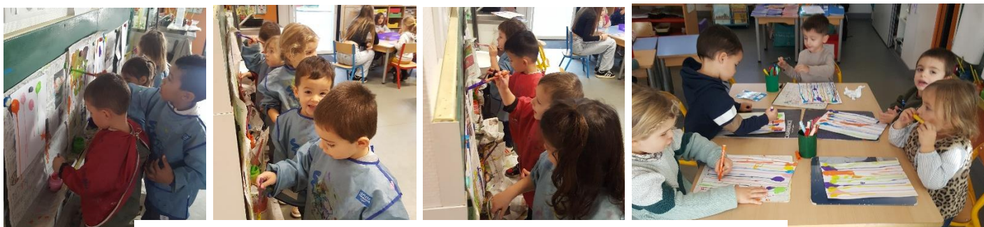
Lignes verticales en faisant couler de la peinture + entrainement sur fiches velledas