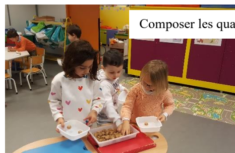
Composer les quantités 4 à 6