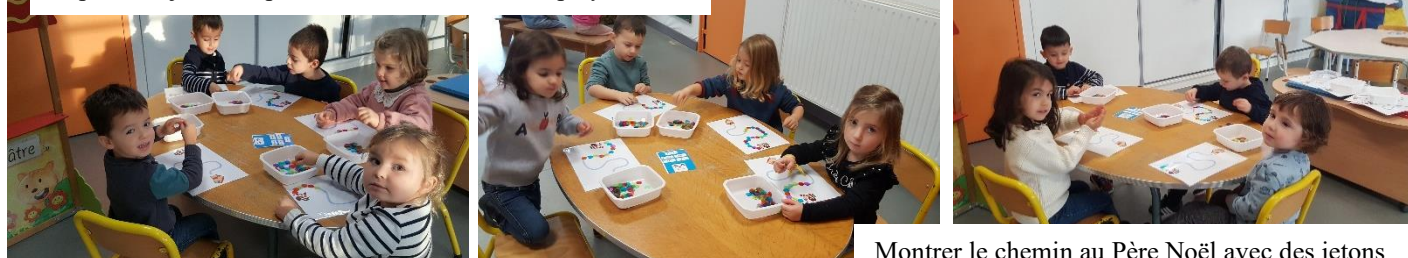
Montrer le chemin au Père Noël avec des jetons