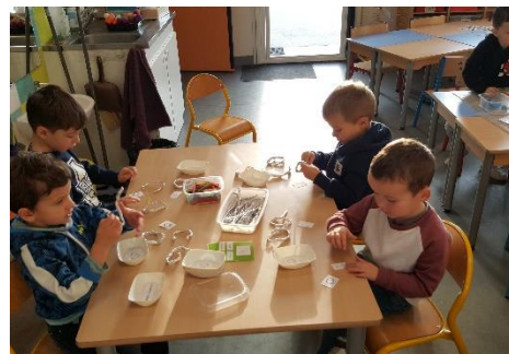
Ecrire les lettres Ovale