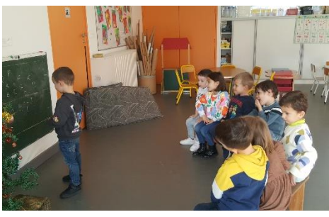
Apprendre à lire et écrire le mot NOËL