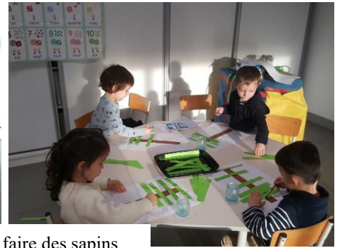
avec des colombins de pâte à modeler et des bandes pour faire des sapins