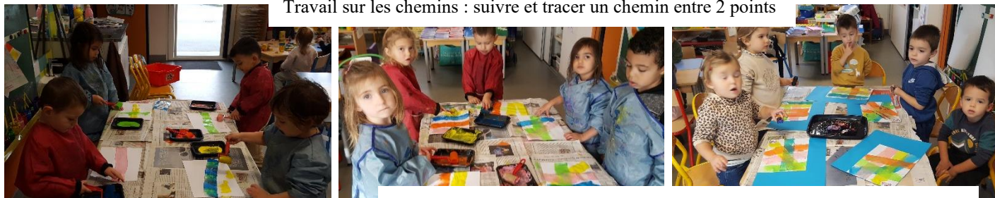
A la peinture : peindre une route au rouleau puis la suivre avec une voiture