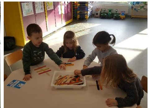
des bâtonnets et le jeu colorino...