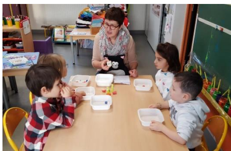
Reconnaitre les constellations 4 à 6