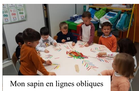
Mon sapin en lignes obliques