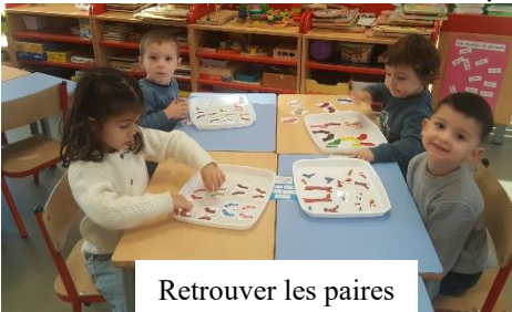
Retrouver les paires