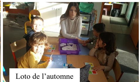
Loto de l'automne