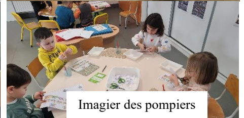
Imagier des pompiers