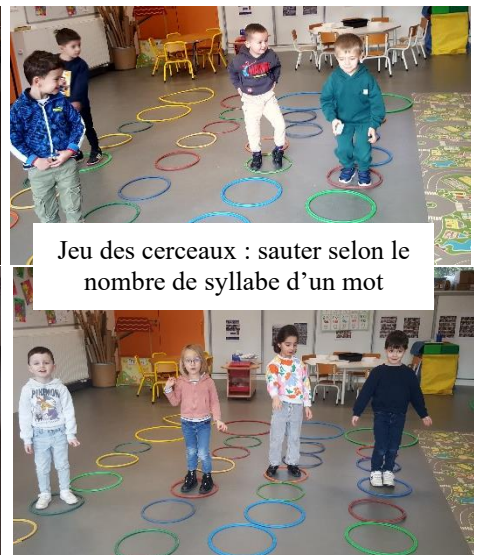
Jeu des cerceaux : sauter selon le nombre de syllabe d'un mot