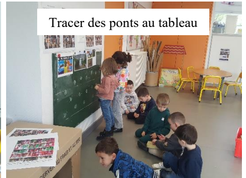
Tracer des ponts au tableau