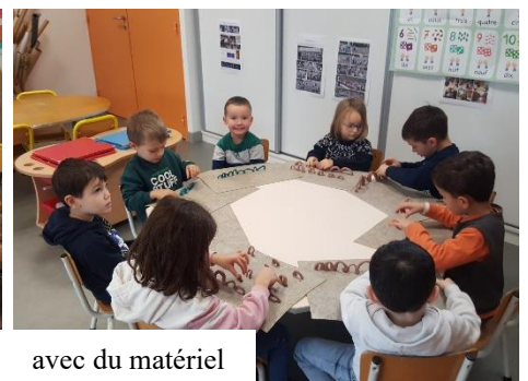
avec du matériel