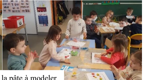
Décoration de couronnes avec la pâte à modeler