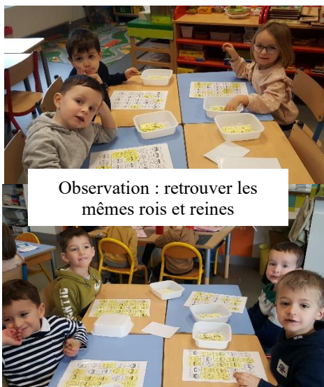
Observation : retrouver les mêmes rois et reines