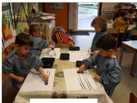
Freiner son geste