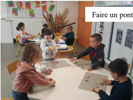
Faire un pont avec du matériel