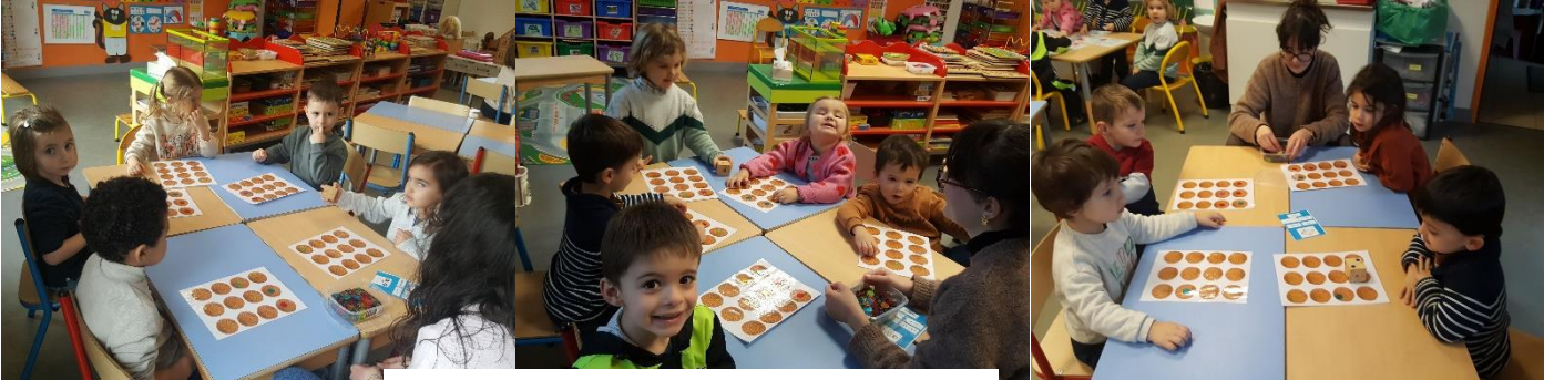
Numération : jeux des galettes et des couronnes