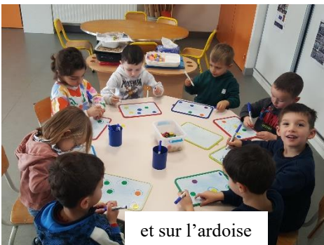
et sur l'ardoise