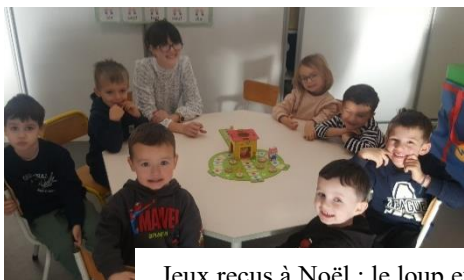
Jeux reçus à Noël : le loup et les cochons et cherche et trouve