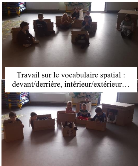
Travail sur le vocabulaire spatial : devant/derrière, intérieur/extérieur...