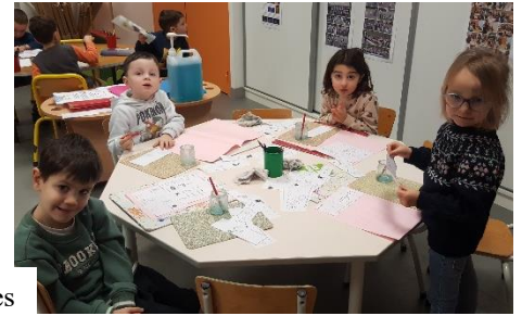
Lecture de la recette et remise en ordre des étapes