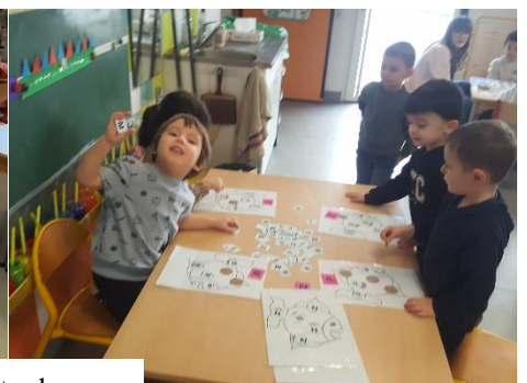
Travail sur son initiale : la reconnaître et en connaître le son