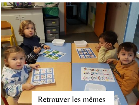
Retrouver les mêmes bonhommes de neige