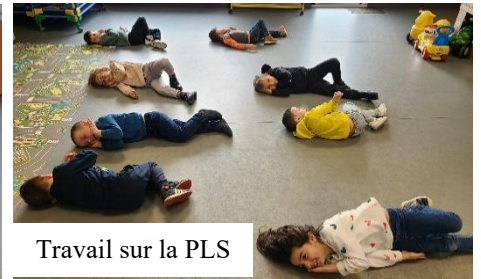
Travail sur la PLS