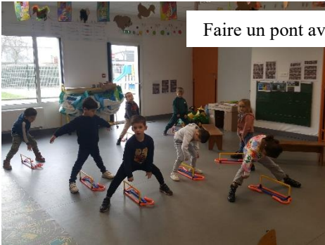
Faire un pont avec son corps