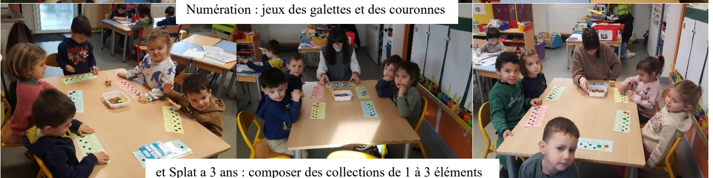
et Splat a 3 ans : composer des collections de 1 à 3 éléments