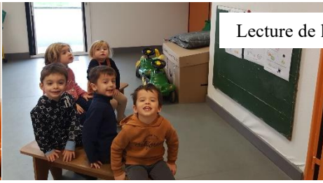
Lecture de la recette