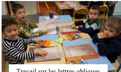
Travail sur les lettres obliques