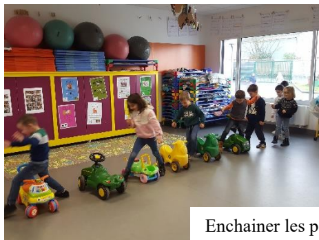
Enchaîner les ponts : avec son corps