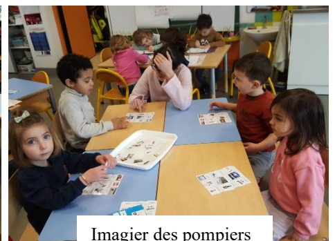
Imagier des pompiers