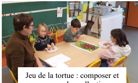
Jeu de la tortue : composer et comparer des collections