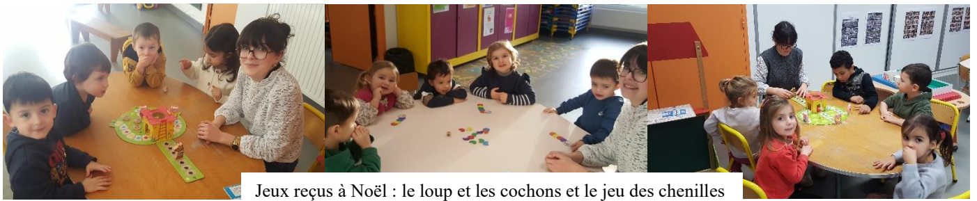
Jeux reçus à Noël : le loup et les cochons et le jeu des chenilles