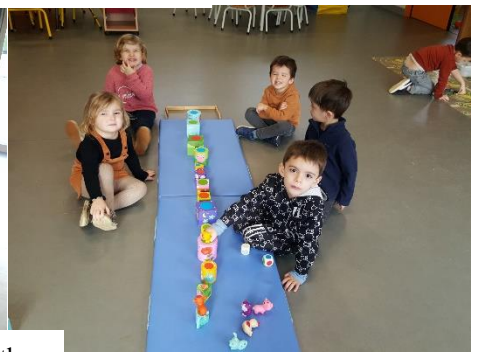
Suite du travail sur les chemins, les labyrinthes