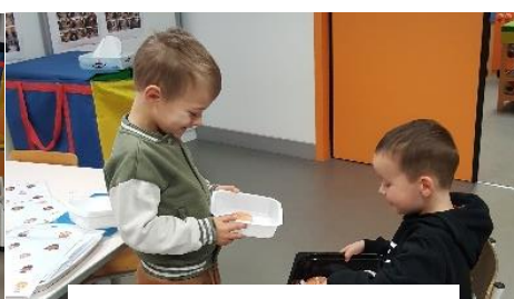
Jeu du marchand de galettes