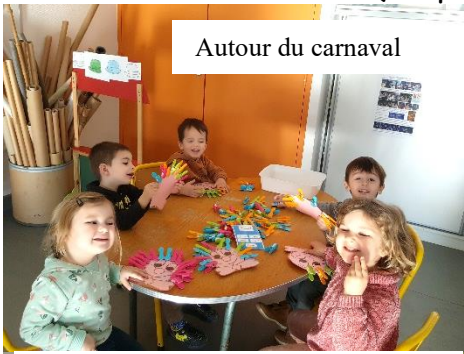
Autour du carnaval