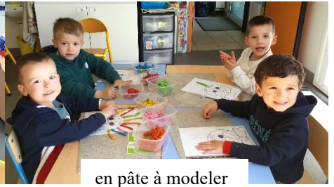
en pâte à modeler