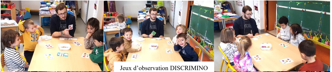
Jeux d'observation DISCRIMINO