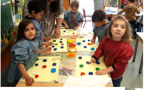
Avec de la peinture au doigt et au feutre sur la comptine des poissons