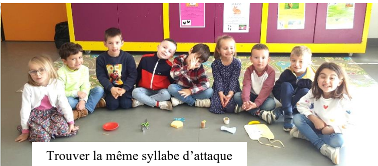
Trouver la même syllabe d'attaque