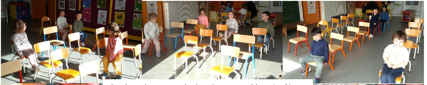
Jeu des trains : apprendre à repérer une position : 1 er , 2 ème ...