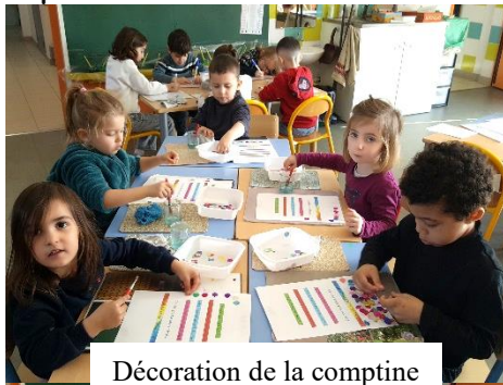
Décoration de la comptine avec des cotillons