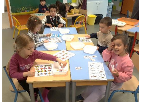
Suite du travail sur les ronds avec du matériel