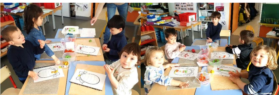
Autour de Pâques : Pâte à modeler