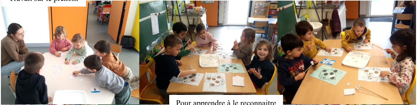
Pour apprendre à le reconnaître