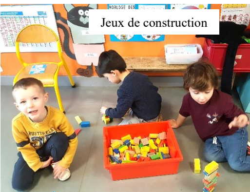
Jeux de construction