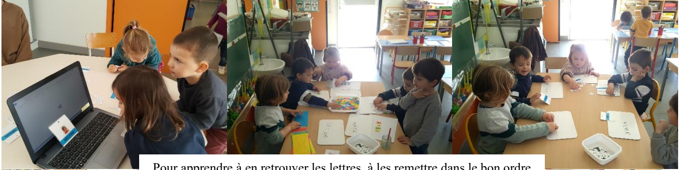
Pour apprendre à en retrouver les lettres, à les remettre dans le bon ordre