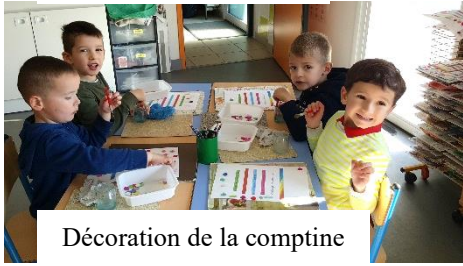
Décoration de la comptine