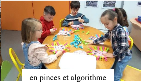
en pinces et algorithmme