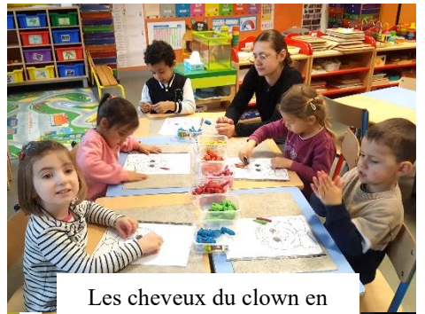
Les cheveux du clown en pâte à modeler