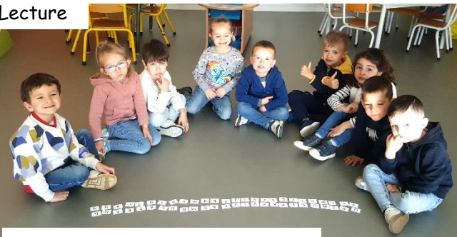
Associer lettres scriptes et majuscules