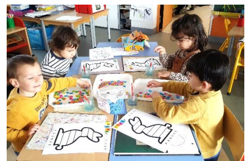
Reconnaitre les mêmes lettres et graphisme décoratif du lapin