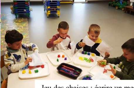
Jeu des chaises : écrire un message pour en avoir le bon nombre