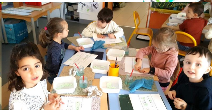
Reconstituer des mots : retrouver les mêmes lettres