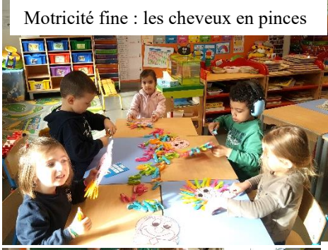
Motricité fine : les cheveux en pinces