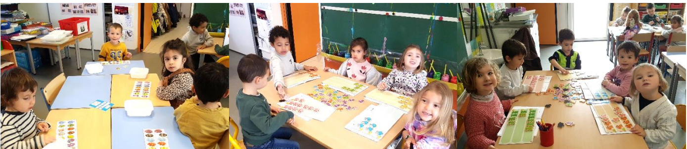
Nouveaux ateliers du cahier : les premiers nombres (travail sur les petites quantités) et les escagrot (travail sur les algorithmes)