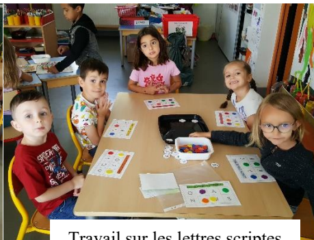
Travail sur les lettres scriptes