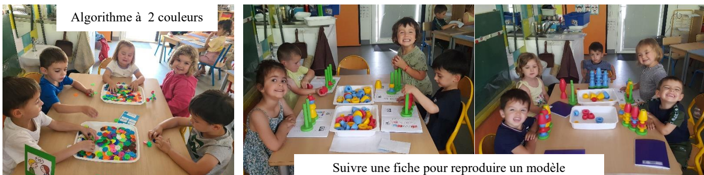
Suivre une fiche pour reproduire un modèle