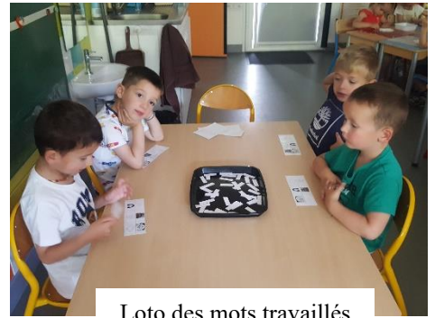
Loto des mots travaillés