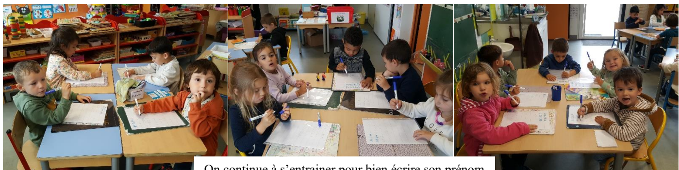
On continue à s'entraîner pour bien écrire son prénom