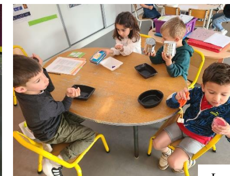
Lourd / léger