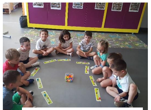
Je des escargots avancer/reculer