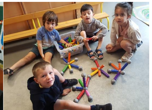
Reproduire un modèle en volume