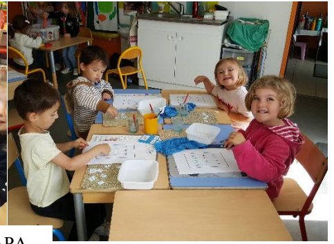
Retrouver les lettres de BONNE FETE PAPA